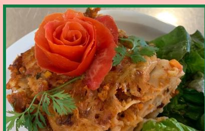
Les lasagnes végé' !

Vous êtes nombreux.ses à aimer notre rubrique des recettes , et à chercher des recettes végétariennes qui fonctionnent (auprès des enfants notamment). Certain.e.s d'entre-vous nous ont partagé des ressources avec quelques recettes que nous aimerions vous proposer !