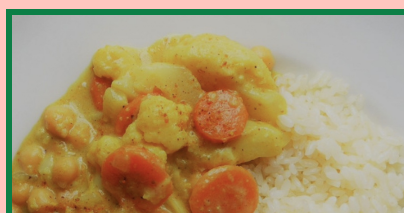
Curry de pois chiches aux légumes de saison.