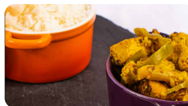
Vindaye de tofu

Direction Maurice pour ce Vindaye végétarien !