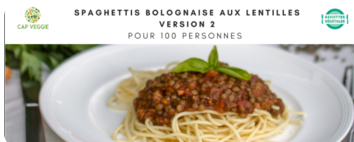
Spaghettis à la bolognaise de lentilles