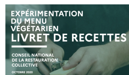
Livret de recette diversification protéines