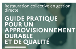
Guide rédaction des marchés publics